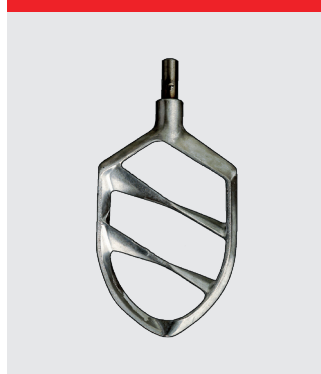
Spartel med to stifter, aluminium