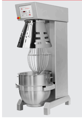
Marineversion, rustfrit stål