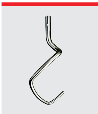
Krog med to stifter, rustfrit stål