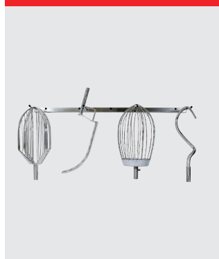
Ophæng til værktøj, 127 cm