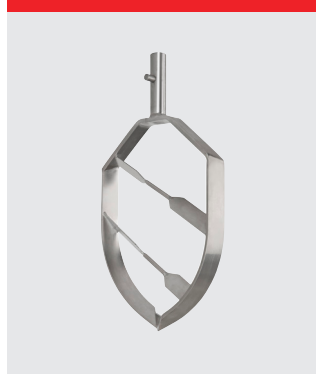
Spartel med to stifter, rustfrit stål