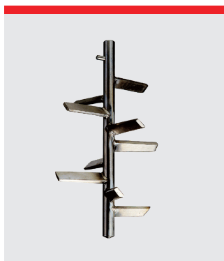
Pulverblender med to stifter, rustfrit stål