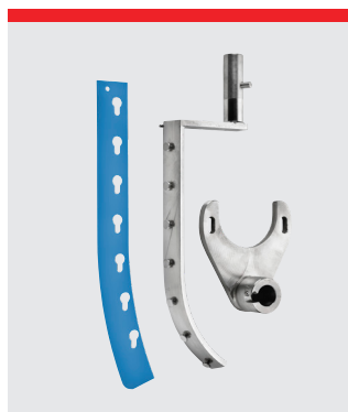
Automatisk skraber, rustfrit stål.