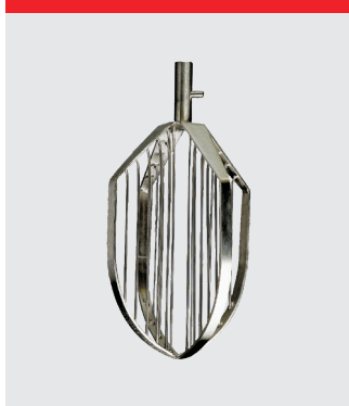
Røris med to stifter, rustfrit stål