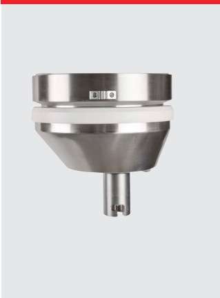
Vandtæt rørehoved, rustfrit stål, IP54