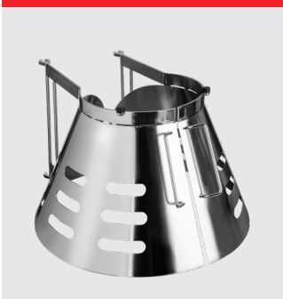
Aftagelig sikkerhedsskærm i rustfrit stål. CE-certificeret