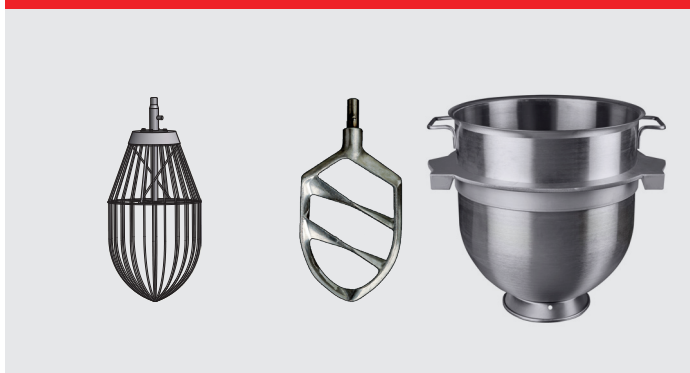
Centerforstærket ris med to stifter, spartel med to stifter og kedel 140 liter i rustfrit stål.