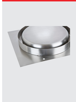
Dobbelt skorsten, rustfrit stål, IP54