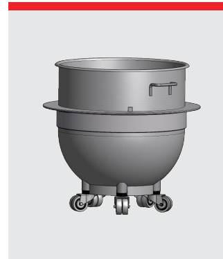
Hjul til kedel