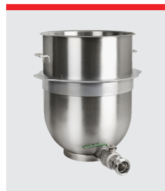
Kedel med afløbsrør i bund, rustfrit stål